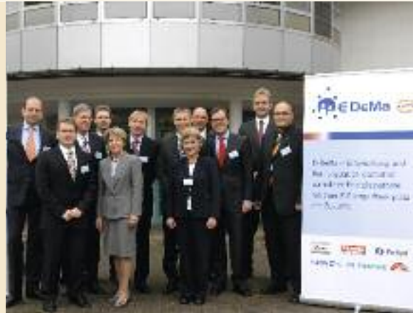
Das Projektkonsortium von E-DeMa bei der Auftaktveranstaltung im November 2008 in Mülheim an der Ruhr

E-DeMa setzt sein Modellvorhaben in der Stadt Mülheim um. In Mülheim werden neben E-DeMa auch Smart Meter und Lösungen aus dem Umfeld E-Mobility realisiert. Die Modellregion liegt im bevölkerungsreichsten Teil Deutschlands und repräsentiert alle Bevölkerungsschichten. Wesentlich am Projekt E-DeMa ist dabei die allgemeine Anwendbarkeit der Lösungen, d. h. es werden für alle Haushalte verallgemeinerbare Lösungen angestrebt.