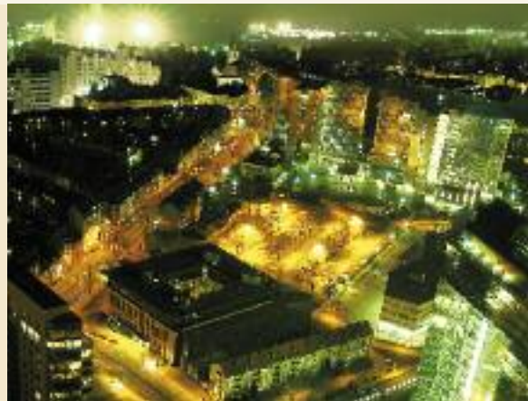
Smart Watts setzt in Aachen das Konzept der intelligenten Kilowattstunde um

Das volle Potenzial der „intelligenten Kilowattstunde“ und der erhöhten Selbstregelfähigkeit des Energiesystems erschließt sich erst durch einen liquiden Markt,