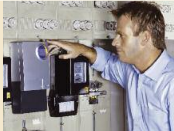
Mit intelligenten Stromzählern lassen sich in Deutschland jährlich 9,5 Milliarden kWh Strom sparen

Ein wichtiger Bestandteil dieses Projekts ist die Entwicklung eines Zertifikats für „Minimum Emission Regions“ und die anschließende Zertifizierung, die wir in der Modellregion beispielhaft durchführen möchten. Zusätzlich erstellt unser Projektkonsortium einen Maßnahmenkatalog und berät Regionen dabei, wie sie ihre Energieeffizienz verbessern können. In Simulationen sollen darüber hinaus unterschiedliche Konzepte und Strategien genauer betrachtet und analysiert werden.