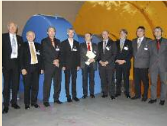
Die Konsortialpartner der Regenerativen Modellregion Harz bei der Auftaktveranstaltung im Dezember 2008 im Pumpspeicherwerk Wendefurth.

Die Elektromobilität zur Netzintegration spielt eine nicht unwichtige Rolle im Projekt. So ist geplant, mehrere Fahrzeuge umzurüsten und zu betreiben. Dazu werden sie mit einer bidirektionalen Schnittstelle versehen und können Energie auch wieder in das Energienetz einspeisen. Neben der Funktion der Fahrzeuge als Speicher sollen auch die Möglichkeiten des Lastmanagements untersucht werden, d. h. das