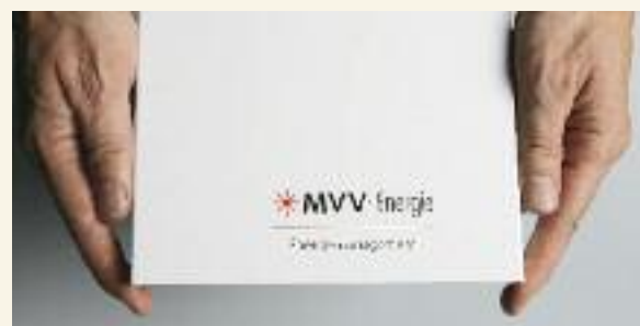
Der Energiebutler® im Projekt Modellstadt Mannheim erlaubt individuelles Energiemanagement, Realisierung dynamischer Tarife und Demand-Response-Mechanismen, um z. B. Kühlgeräte dann abzuschalten, wenn der Strom teuer oder nicht aus regenerativen Quellen erhältlich ist.

E-Energy wird nicht nur zu neuen Dienstleistungen, sondern auch zu einer Vielzahl von neuen technischen Produkten führen, die es auch zu installieren und zu warten gilt. Viele kleine und mittlere Unternehmen – nicht zuletzt das Elektrohandwerk – werden davon ebenso profitieren wie Ingenieurfirmen, Hard- und Softwareproduzenten und die am Weltmarkt operierenden Unternehmen des Energieanlagenbaus.