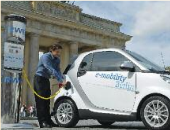
Tanken, wenn der Wind weht: Mit den IKT-Lösungen von E-Energy kann die Batterie des Elektrofahrzeugs dann geladen werden, wenn es günstigen Strom aus erneuerbaren Energien gibt.

Wenn IKT- und Energiewirtschaft erfolgreich zusammenarbeiten und branchenübergreifend Produkte, Verfahren und Dienstleistungen entwickeln, können die Weichen für das Energienetz der Zukunft gestellt werden. Es gilt, Endgeräte mit der nötigen Intelligenz für die Einbindung in das Internet der Energie auszustatten. Neue Speichertechnologien werden vorangetrieben, wobei auch kleine, dezentrale Speicher eine Chance erhalten, in das Netz integriert zu werden. Dezentrale Erzeugungsanlagen gilt es so auszustatten, dass sie nicht nur Strom erzeugen, sondern auch Systemdienstleistungen erbringen. Und nicht zuletzt wird E-Energy die notwendigen Technologien für die Systemintegration der Elektromobilität schaffen. In dem Maße, in dem durch E-Energy die positiven Effekte der Netzintegration von Elektrofahrzeugen genutzt werden können, wird diese Technologie weitere Innovationsanreize erhalten.