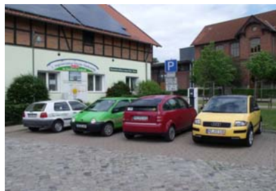
Büro der RegenerativKraftwerkeHarz GmbH & Co. KG

Selbstverständlich sind auch die Beratungsbüros bei den Partnerunternehmen in Wernigerode, Blankenburg und Quedlinburg jederzeit bereit Ihre Fragen zu beantworten. (siehe Seite 2)