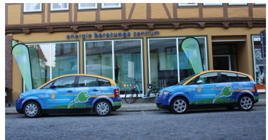
Energieberatungszentrum Osterwieck Am Markt 10

Täglich erreichen uns neue Meldungen über die Energiewende, die knapper werdenden Ressourcen und den Umbau der Energieversorgung auf den Einsatz erneuerbarer Energien.