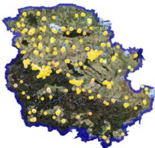
Interaktive Darstellung der EE-Erzeugungsstandorte im Landkreis Harz